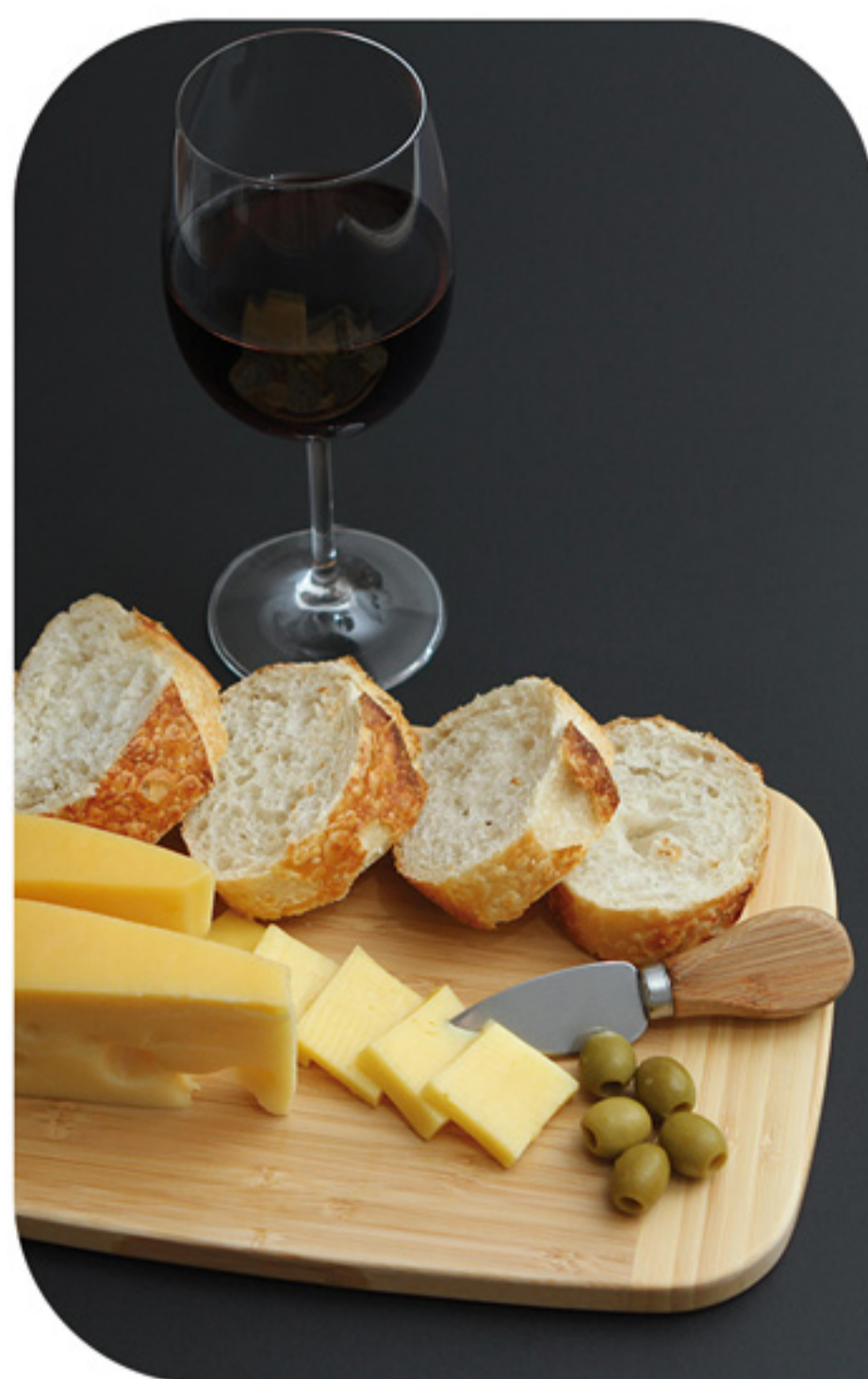
TABLA ELDORET | HM-056

Tabla de bambú con cortador para queso fabricado en acero inoxidable con mango de madera. Incluye caja de cartón individual.